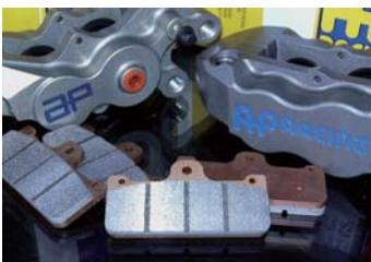
※イメージ写真です。

スタンダードとSpec 03の2種類をご用意 通常使用の場合はスタンダードを、レース&スポーツ 使用や重量車にはSpec 03をお勧めいたします。