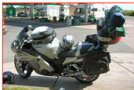
たくさんの荷物を積んで...