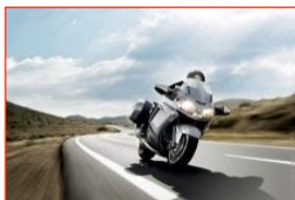
高速道路を使って...